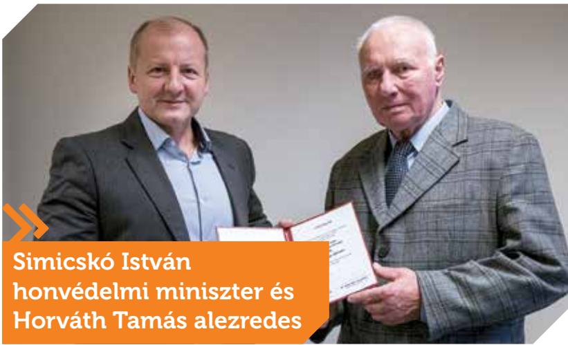
Simicskó István honvédelmi miniszter és Horváth Tamás alezredes

Simicskó István honvédelmi miniszter kezdeményezésére terjedt el az a szokás, hogy a szép kort megélő, kerek születésnapos nyugállományú katonákat ünnepélyes keretek között személyesen köszöntik fel Újbudán. Január elején Horváth Tamás alezredest 80., Tokodi István őrnagyot 85. születésnapja alkalmából köszöntötték.